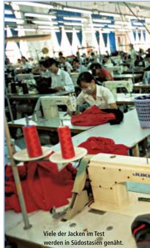
Viele der Jacken im Test werden in Südostasien genäht.

„Mangelhaft“ war auch die Beständigkeit des Oberstoffs der Vaude und der Maier Sports Jacke. Schon nach wenigen Tausend Scheuertouren mit Cordura, einem oft bei Rucksäcken eingesetzten Material, war das Gewebe deutlich angegriffen – nichts für Wanderer also. ■