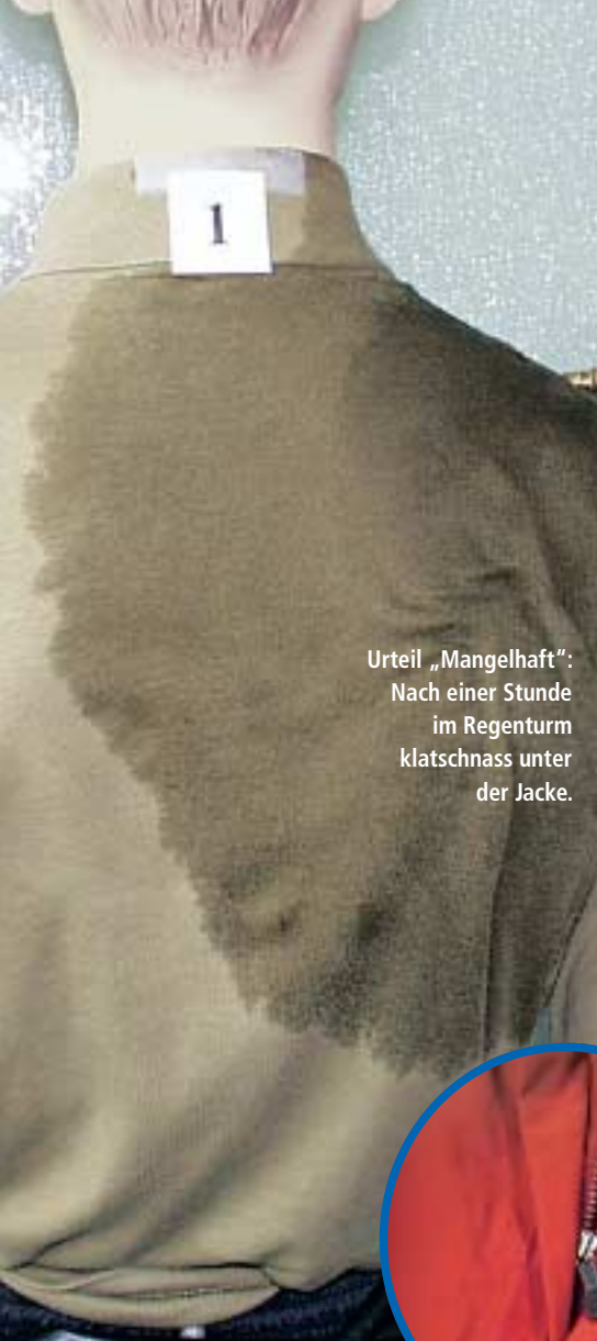
Urteil „Mangelhaft“: Nach einer Stunde im Regenturm klatschnass unter der Jacke.